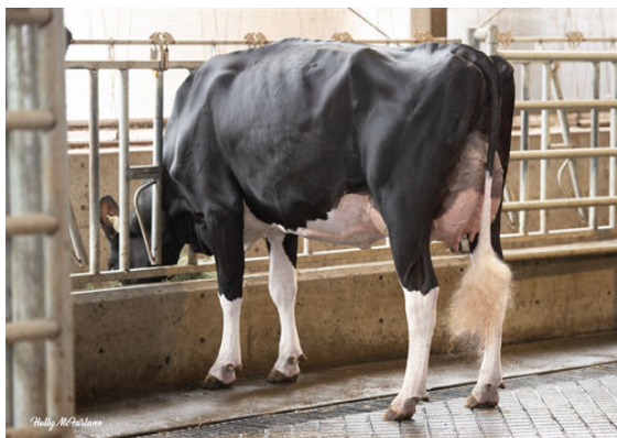
PROGENESIS CHAMPION PALAZZO DAUGHTER

PEAK HOTJOB PROGENESIS GTEE CABERNET RED VG-87-4YR-CAN WESTCOAST GUARANTEE HOLLENDALE JEDI CRIM-RED VG-88-5YR-USA 2* S-S-I MONTROSS JEDI RI-VAL-RE TG CRIMSON-RED VG-86-2YR-USA